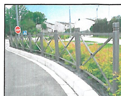
ALTERNATYWNE WERSJE BARIER OCHRONNYCH PROPONOWANYCH PRZY SZKOLE.