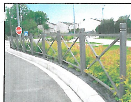
PRZYKŁADOWE BARIERY OCHRONNE PROPONOWANE PRZY SZKOLE