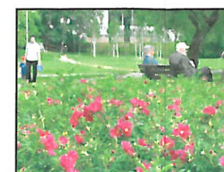
PROPONOWANA RÓŻA W ODM. Short Track, WYJĄTKOWO ODPORNA NA ZASOLENIE.