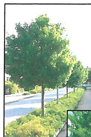
PROPONOWANE DRZEWA SZPALEROWE SZPALEROWE TOLERUJĄCE SUSZĘ, ZASOLENIE ORAZ ZANIECZYSZCZENIA POWIETRZA - KLON POLNY W ODM. Elsrijk