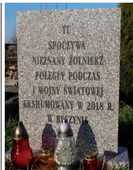
Pamiątkowa tablica w Popkowicach.

Promocja książki odbyła się podczas XV Zjazdu Towarzystw Regionalnych Lubelszczyzny w Urzędowie. Oprócz wersji papierowej, wspomnienia możemy także czytać w postaci e-booka na stronie Ośrodka Kultury pod adresem: https://gokurzedow.pl/projekty/22265/