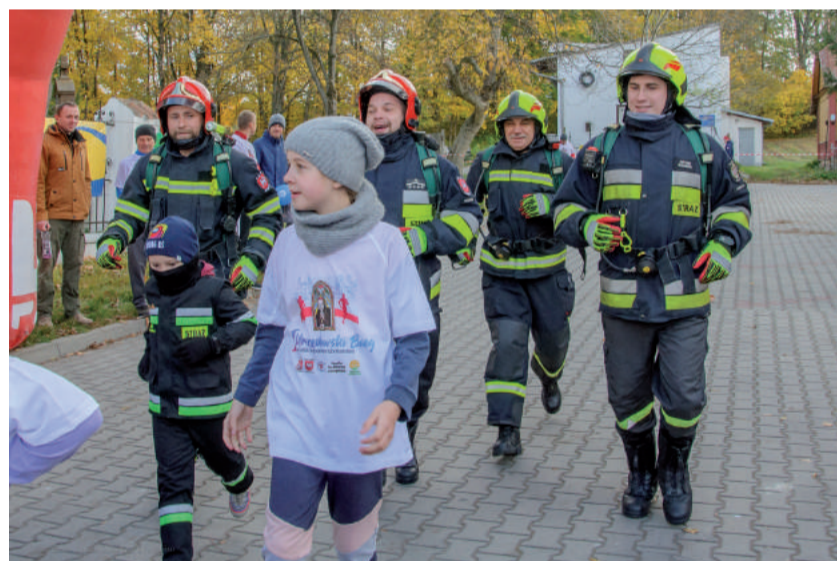
Dzielni drухowie OSP również pokonali trasę biegu.

Zbigniew Stec Stec Rally, Wodbud Kraśnik, Ekoland Kraśnik, WAT Producent Blach Dachowych, MAR JOLA Materiały budowlane, Geo-Mat Mateusz Piekarczyk, Husqvarna, Guittard, Moto-Gama, Owocmix Sp. z o.o., WKW Kraśnik.