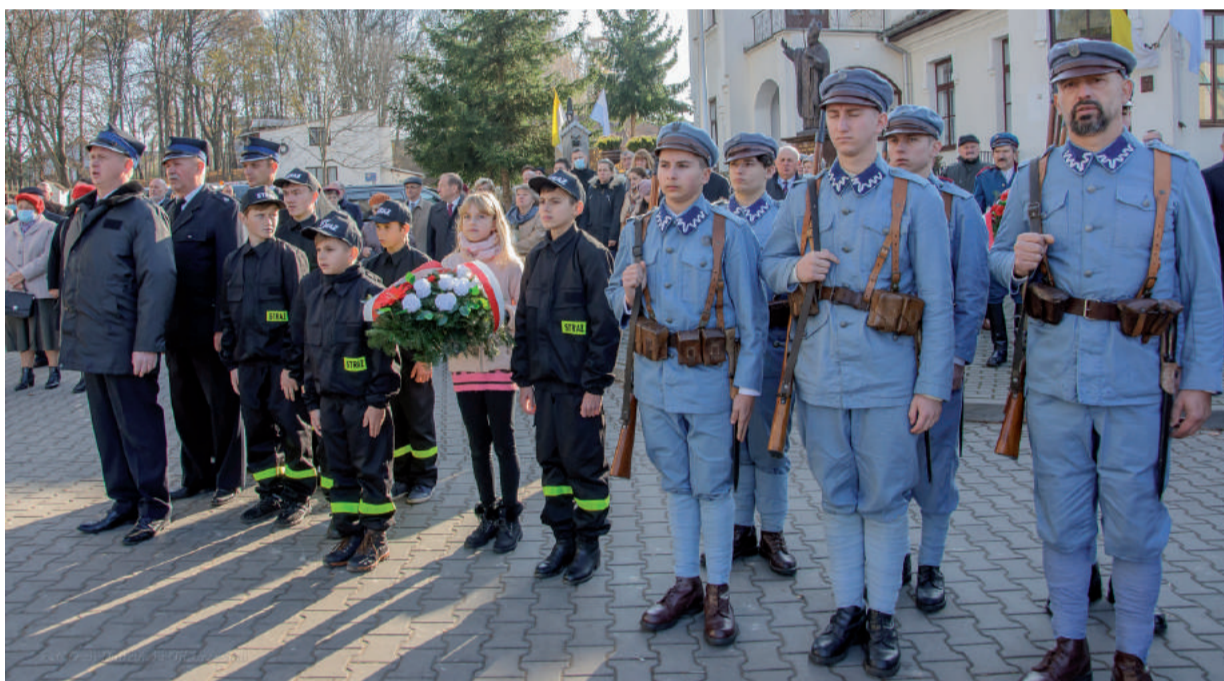
Grupa Rekonstrukcyjna „Legun” pełniła wartę przy miejscach pamięci.