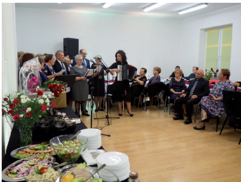
Seniorzy zaprezentowali swoje wokalne umiejętności.