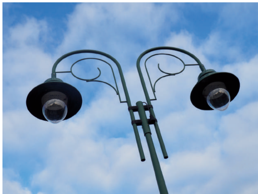
W projekcie przewidziano 83 sztuki opraw ozdobnych.

W wyniku realizacji przedsięwzięcia nastąpi redukcja zużycia energii elektrycznej, a co za tym idzie zmniejszenie emisji szkodliwych substancji i gazów cieplarnianych do atmosfery.