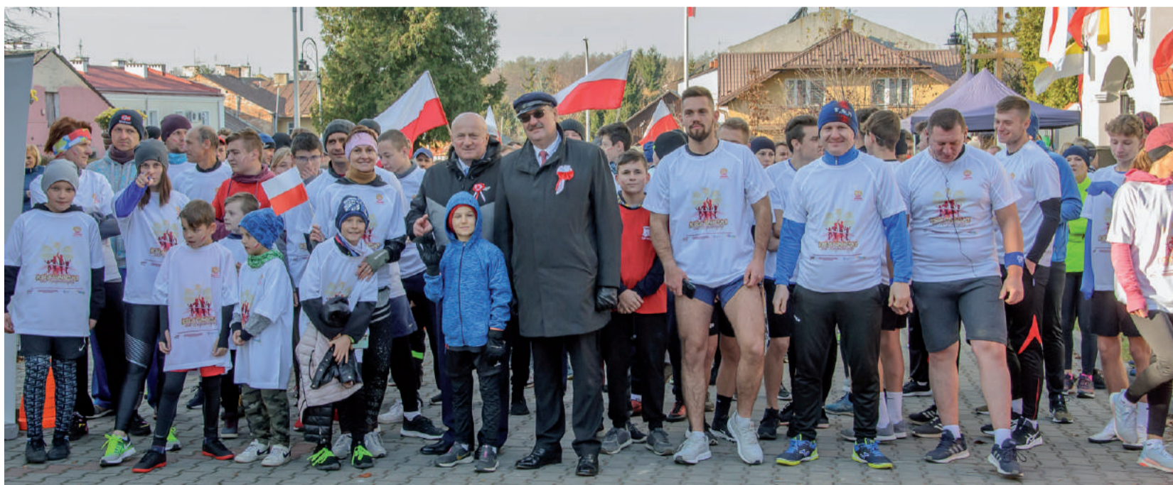
Przed startem na „czerwonej” trasie biegu „Kraśnicki dla Niepodległej”.