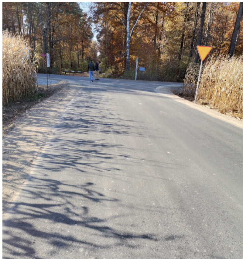
JC Modernizacja poprawi bezpieczeństwo na tej drodze.

Inwestycja ta była długo wyczekiwana przez mieszkańców Popkowic Księżych oraz mieszkańców sąsiedniej Gminy Wilkołaz, a dokładnie wsi Kolonia Ostrów, gdzie już kilka lat wcześniej został położony dywanik bitumiczny. Brakujący odcinek drogi łączący się z drogą powiatową na terenie naszej gminy był trudno przejezdny zwłaszcza po opadach deszczu. Teraz w końcu mieszkańcy mogą podróżować, nie brudząc zbyt wiele swoich aut. Poprawa stanu tej drogi z pewnością wpłynie na podwyższenie bezpieczeństwa w ruchu drogowym na tym odcinku.