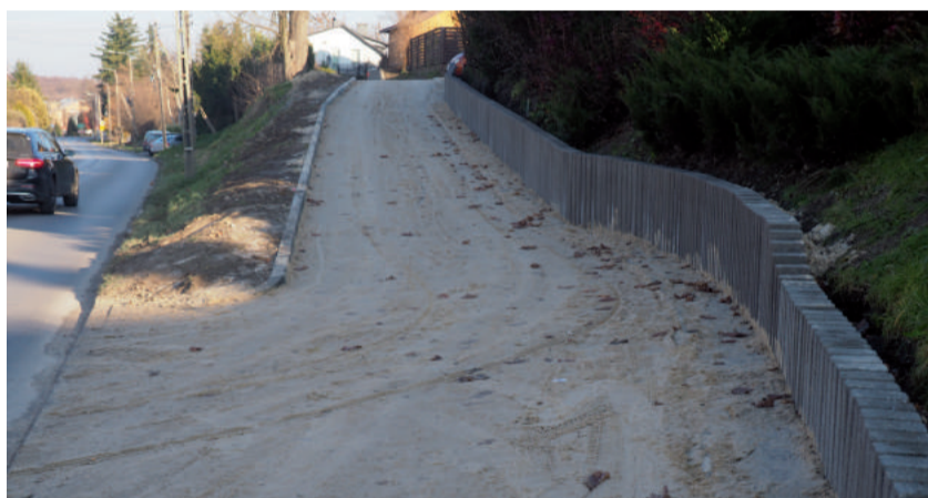
Mieszkańcy zyskali lepszy dojazd do swoich domów.