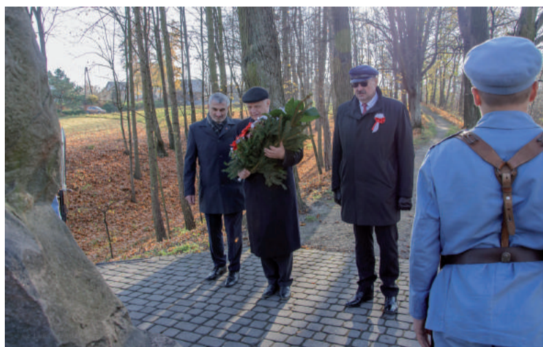
Podczas składania wiązanki kwiatów przy Orłętach Lwowskich.