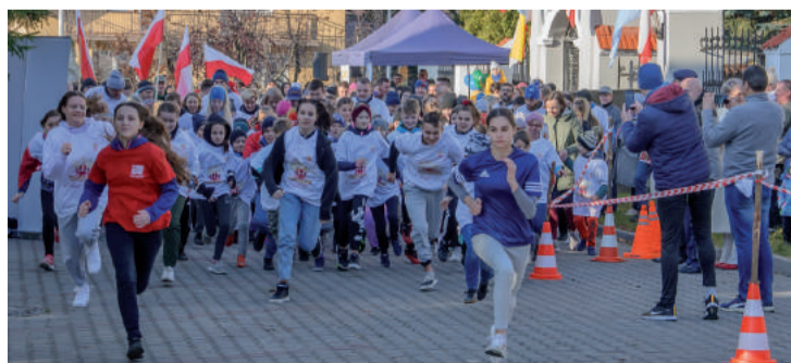
Uczestnicy „Biegu Kraśnickiego dla Niepodległej”.