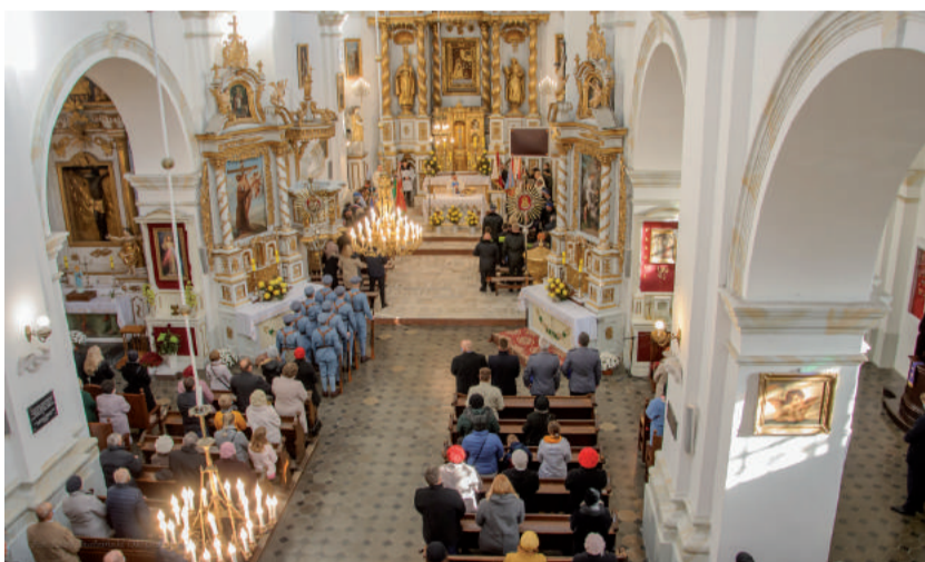
Podczas mszy św. modlono się w intencji ojczyzny.