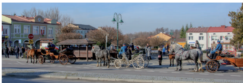
W uroczystości tradycyjnie wzięło udział Stowarzyszenie Miłośników Koni „Podkowa”