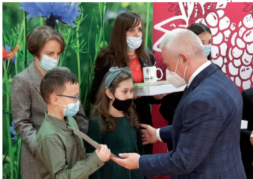
Uczniowie ZSO podczas odbierania wyróżnień.

Koordynator konkursów z ramienia ZSO w Urzędowie