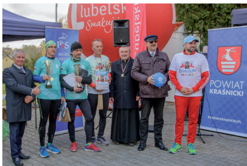
Organizatorzy ze zwycięzcami najtrudniejszej, czerwonej trasy biegu.