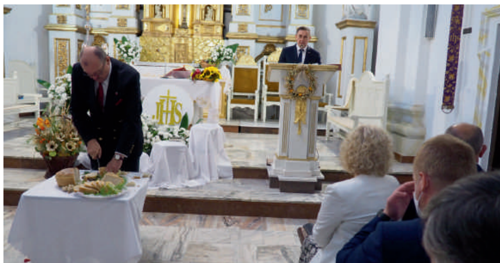
Dożynkowy chleb dzielił m. in. burmistrz Urzędowa.