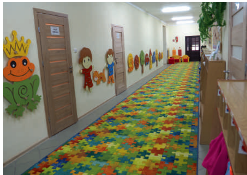
Przedszkolny korytarz po remoncie.