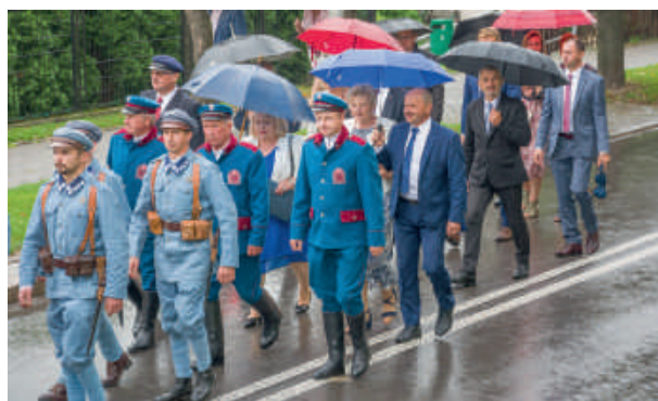
Uczestnicy dożynkowego korowodu.