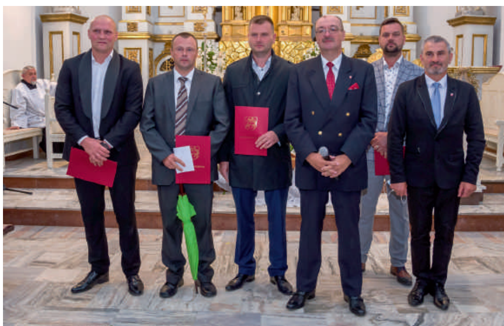
Nagrodzeni rolnicy z władzami Urzędowa.