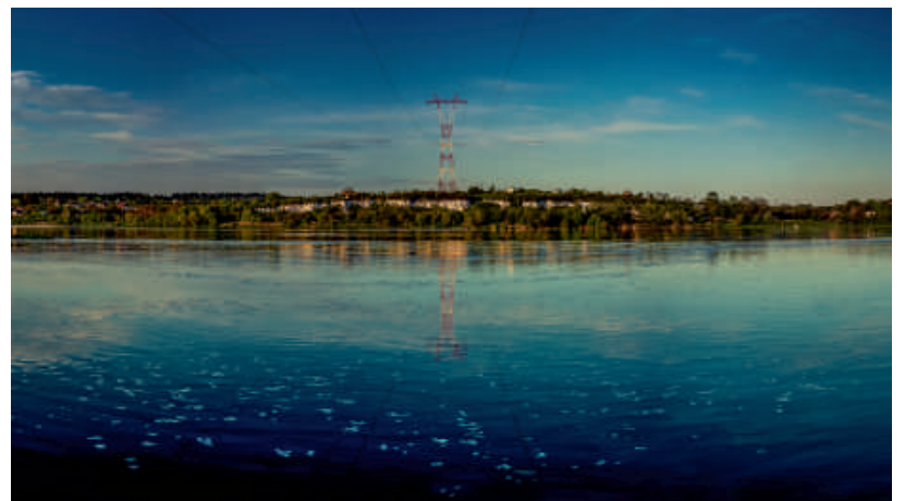
Annopol - brama Lubelszczyzny.

Nagrody ufundowało Starostwo Powiatowe, a drobne upominki Urząd Miejski w Urzędowie. Dziękujemy wszystkim za udział w konkursie i jeszcze raz gratulujemy zwycięzcom. JC