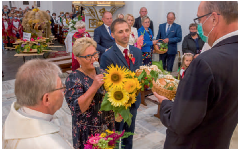
Przekazanie dożynkowego chleba.

- Te wieńce dożynkowe i chleb świadczą o wielkim sensie ludzkiej pracy, waszej pracy drodzy rolnicy. Dlatego