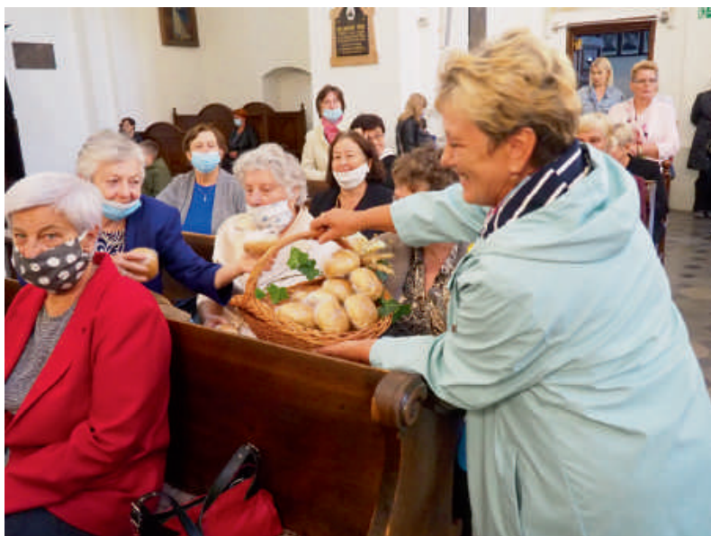
Panie z „Klubu seniora” pomagają w rozdawaniu chleba.