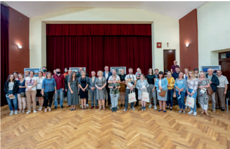
Uczestnicy wernisażu wystawy pokonkursowej KRAJOBRAZ POWIATU KRAŚNICKIEGO.

godz.18.00 – Zajęcia astronomiczne – instr. J. Baran – świetlica