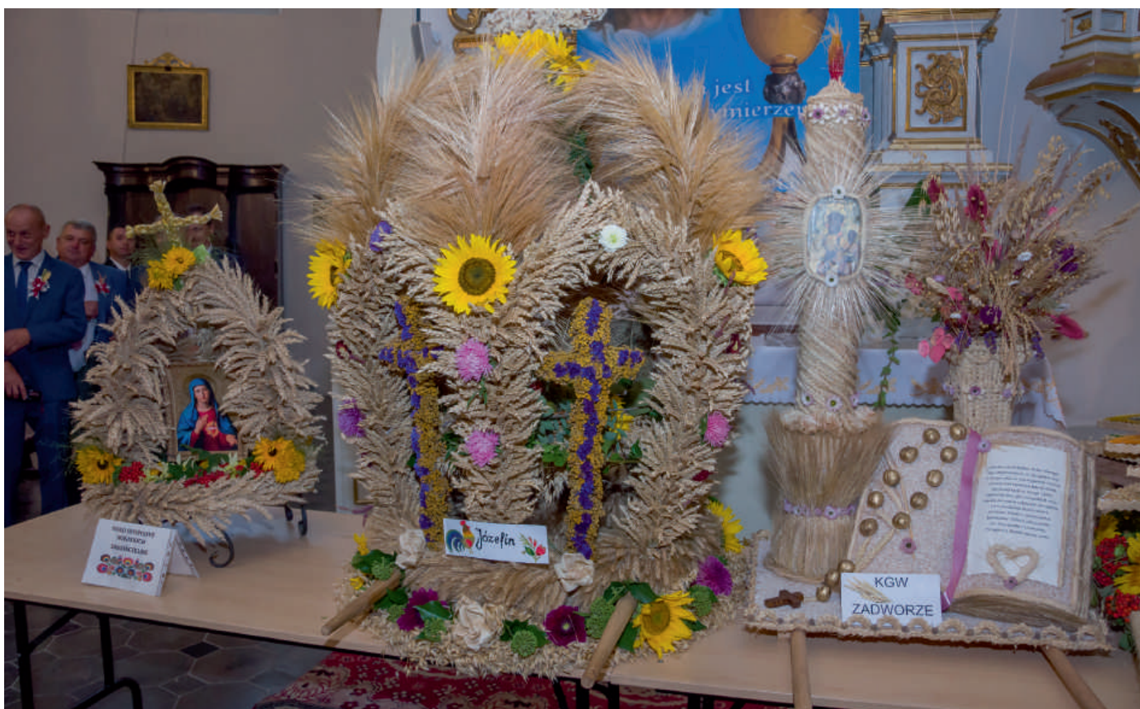
W konkursie wieńcowym I miejsce ex aequo zdobyli: KGW Józefin i SP Moniaki.