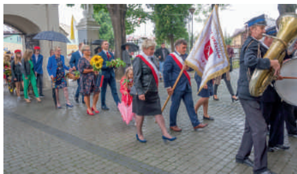
Uroczyste wejście do urzędowskiego kościoła.