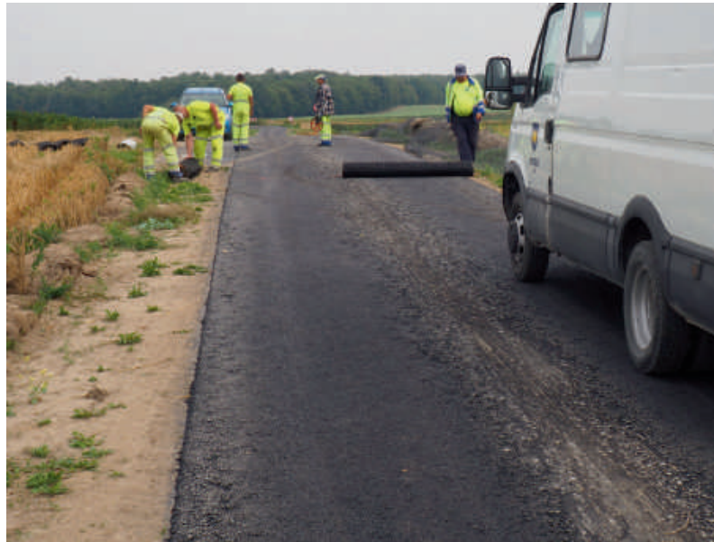
Mieszkańcy Józefina od września korzystają z odnowionej drogi.

Jeśli chodzi o poprawę stanu gminnych dróg polnych to systematycznie prowadzone są tam zadania w ramach Funduszy Sołeckich, oczywiście w tych sołectwach, które zdecydowały się te środki