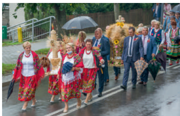
Barwny korowód dożynkowy rozpoczął uroczystości.